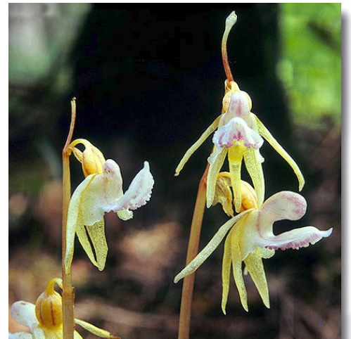
Der Widerbart – eine einheimische Orchidee

Seltene und seltsame Schönheiten – Ein abgestürzter Dichter, Kanonenkugeln auf eine Stadt, eine untergetauchte Nymphe – was hat das mit unserer einheimischen Wildflora zu tun? Eine Blume ist der Spiegel der Umgebung, in der sie lebt. Und die Menschen, die in dieser Landschaft verwurzelt sind, sahen in ihnen Abbilder ihrer selbst und der Geschichten- und Sagenwelt, mit der sie ihr Leben ausschmückten. Übrigens: Eine der seltensten Kleinodien unserer Heimat überlebt Naturschutzmaßnahmen nicht. Wir besuchen Naturräume, die ihre Existenz nur der Ausbeutung des Bodens durch den Menschen verdanken. Eine weitere Wildpflanzenart ist nicht die, die sie zu sein scheint. Lassen Sie sich überraschen – und erleben Sie Bilder von einzigartiger Eindringlichkeit