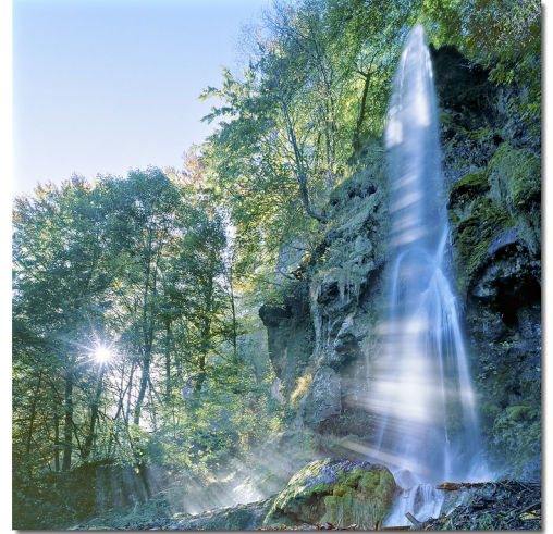
Seit Millionen Jahren an der Arbeit: Wasser

Eine Landschaft wie eine Chronik , die eine 150 Millionen Jahre währende Geschichte erzählt: Das ist die Schwäbische Alb. Die Kapitel reichen von der Urgeschichte über die Entwicklungsperioden des Menschen, die Jahres- und Tageszeiten bis hin zum flüchtigen Moment der Gegenwart, der Minuten später schon wieder in die Vergangenheit gehört. Kein Moment wird je gleich sein wie der gerade eben vergangene. So war es schon immer – und so wird es immer sein. Die Flüchtigkeit ist das ewig Unveränderliche der Zeit. Die Einmaligkeit des Augenblickes gibt der Schönheit die Gestalt – nicht umgekehrt. Nur das wirklich sehende Auge nimmt dies wahr.